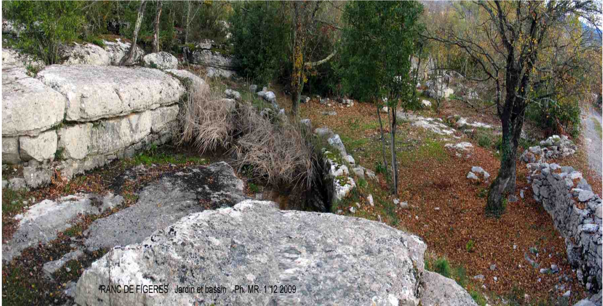
RANC DE FIGERES Jardin et bassin 1 12 2009