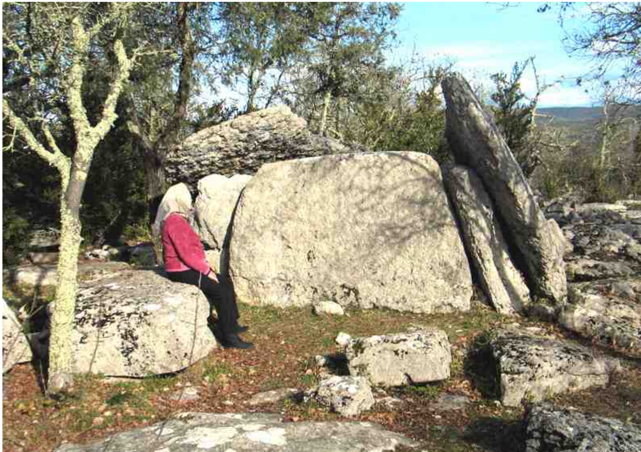
Ranc de Figères Dolmen n°2 , Dalle de couverture brisée