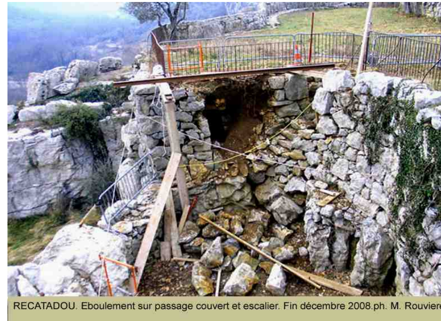
RECATADOU. Eboulement sur passage couvert et escalier. Fin décembre 2008.