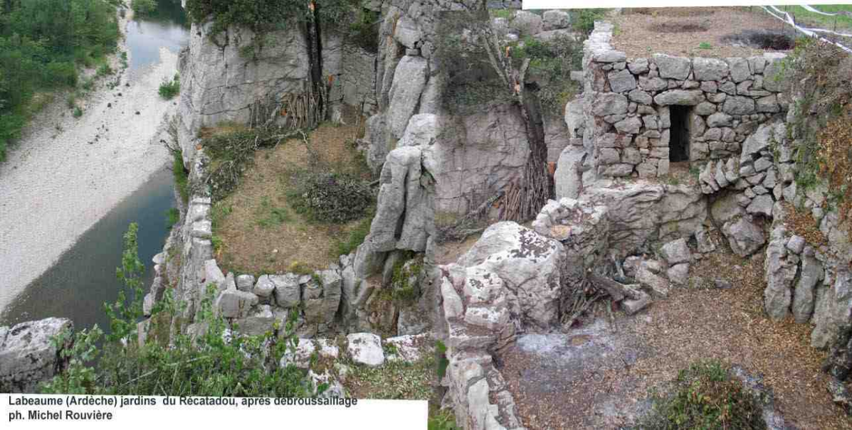
Labeaume (Ardeche) jardins du Recatadou, après débroussaillage