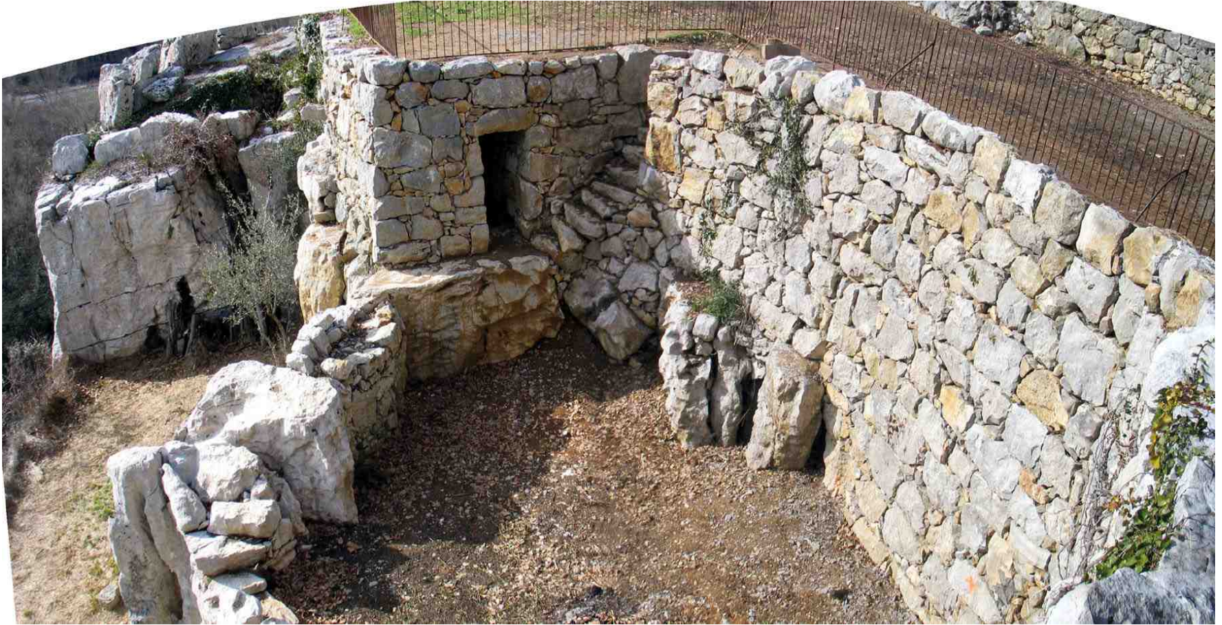
Photo : 31 janvier 2010. Les travaux de reconstruction des murs effondrés sont terminés. Les jardins attendent jardiniers et petit pois!!