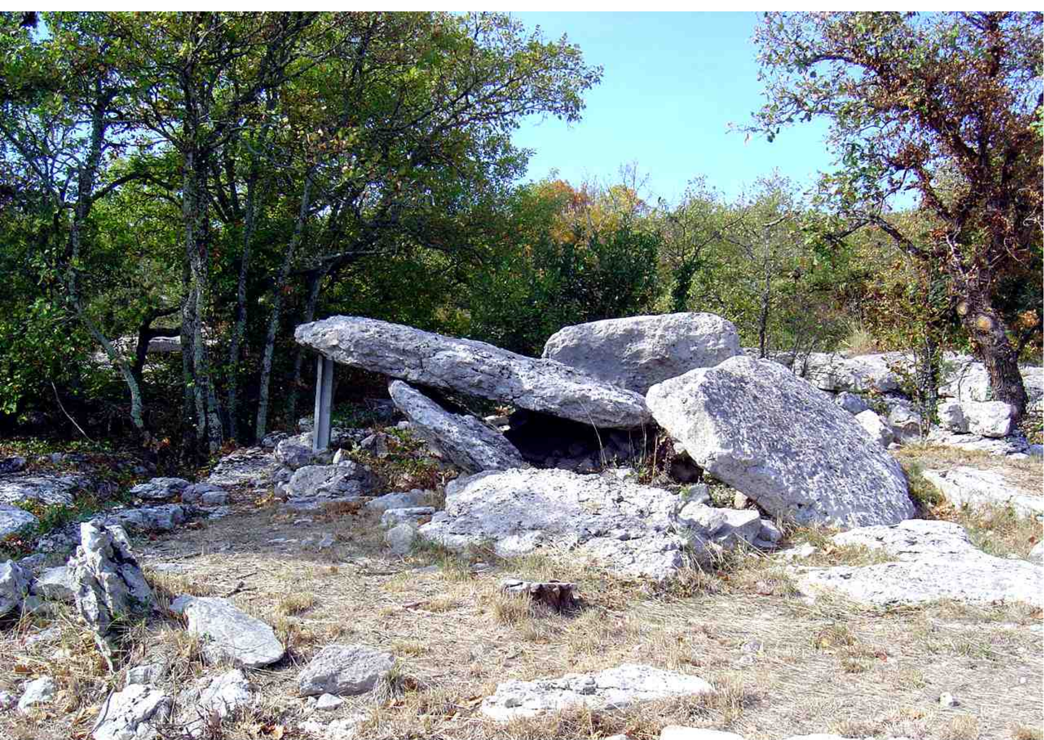
LABEAUME. Ranc de Figères. Dolmen avant restauration.