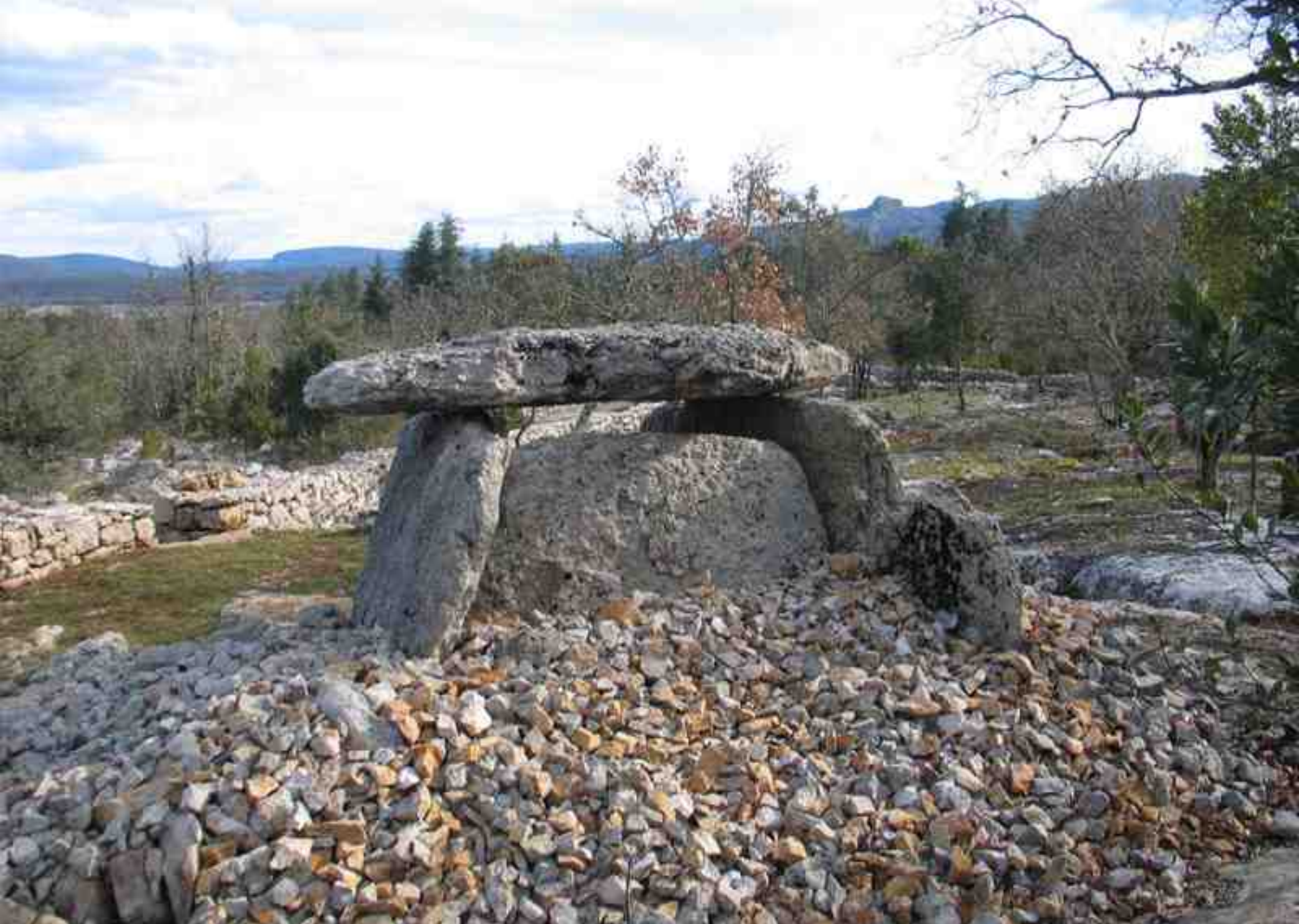
LABEAUME ; « Ranc de Figères » Dolmen I- reconstruit